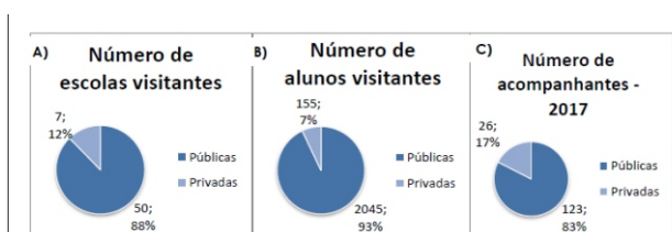
FIGURA 1 – Distribuição dos visitantes da rede pública e privada, conforme A) número de escolas; B) Número de alunos e C) Número de acompanhantes.